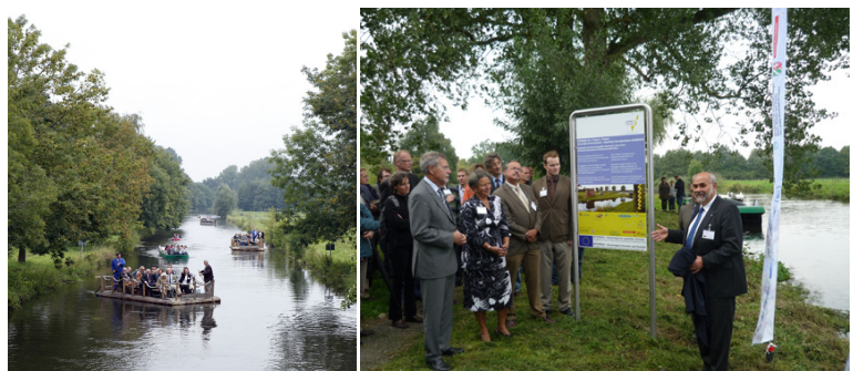
Openingsmanifestatie Nagrewa 9 september 2010

Tot de werkzaamheden behoren o.a. de organisatie van de vergaderingen van de begeleidende projectgroep, de tweetalige verslaglegging, het opstellen van de