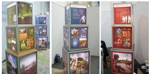
Tentoonstelling Nationaalparkregio MeinWeg

Binnen het project werd een transportabele tentoonstelling geproduceerd, waarin de thema's natuur, cultuur en de mens in de regio op een anschouwelijke manier zijn weergegeven. De tentoonstelling wordt aan weerskanten van de grens op verschillende projectlocaties getoond.