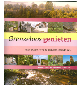
Rapport Triple E

Het voornoemde in opdracht van Staatsbosbeheer in 2009 uitgevoerd onderzoek werd onder de Duitse titel „Grenzenlos genießen Maas-Schwalm-Nette – Von den Möglichkeiten Grenzen zu versetzen“ vertaald. Het onderzoek toont de economische waarde van natuur en landschap voor de regionale economie. Het rapport is opgesteld door het bureau Triple E in Arnhem. Gepland is begin 2011 samen met de gemeenten Wassenberg en Roerdalen de Duitse versie te publiceren en in het kader van een grensoverschrijdend symposium te presenteren.