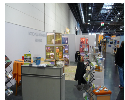
Jaarbeurs Tour Natur in Düsseldorf

In september 2010 was de tentoonstelling centraal onderdeel van een stand op de wandel- en vrijetijdsbeurs Tour Natur in Düsseldorf. Samen met de VVV Midden Limburg, de Heinsberger Tourist Service, 2-Land/Niederrhein Tourismus en de NABU Naturschutzstation Wildenrath werd de regio in een gemeenschappelijk stand gepresenteerd. De beurs werd door ongeveer 40.000 personen bezocht. Uit de met de bezoekers