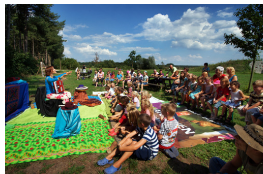
Evenement in het nationaal park De Meinweg

In totaal hebben meer dan 22.200 personen aan de afzonderlijke evenementen deelgenomen. Aan de begeleide fiets- en wandeltochten en excursies werd gemiddeld door 18 personen deelgenomen.