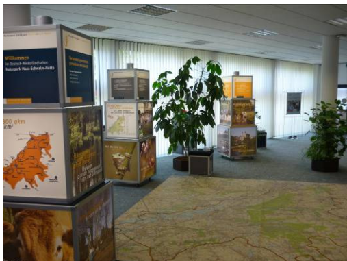
Tentoonstelling Sparkasse Niederkrüchten

De binnen het INTERREG IIIA project „Maas-Swalm-Nette in de picture“ gemaakte tentoonstelling werd in 2010 op de volgende plekken getoond: