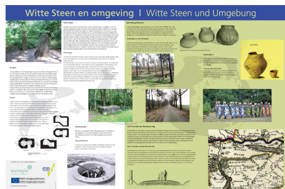
Infopaneel cultuurhistorische route Brügggen en Beesel

Het Grenspark Maas-Swalm-Nette geeft ondersteuning bij de projectcoördinatie, de tweetalige verslaglegging, inhoudelijk overleg en de voorlichting. In 2010 werd de route uitgewerkt en beschreven, communicatiemiddelen voorbereid en Duitse en Nederlandse gidsen opgeleid. Eind 2010 waren de ontwerpen van zowel het manuscript, een folder evenals de infopanelen gereed. De formele opening en presentatie van de route is op 3 april 2011 gepland.