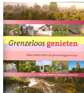
Studie Triple E

Die niederländische Forstbehörde Staatsbosbeheer hat in 2008 eine Studie in Auftrag gegeben, bei der untersucht wurde, inwieweit sich Natur und Landschaft im Meinweggebiet in Wert setzen lassen. Die Studie wurde erstellt durch das Büro Triple E in Arnheim. Kernpunkt der Studie ist die wirtschaftliche Bedeutung für eine Region bei der Vermarktung von Natur und Landschaft. Der Bericht wurde 2009 fertig gestellt und in niederländischer Sprache veröffentlicht. Am 10. November fand in Herkenbosch ein Symposium statt, auf dem der Bericht einem Publikum aus Vertretern von niederländischen Naturschutzbehörden- und Organisationen sowie Vertretern touristischer Organisationen vorgestellt wurde. Der Bericht wird in Kürze übersetzt und auf deutscher Seite vorgestellt. Dabei soll die Diskussion über die Rolle des Naturpark bei der wirtschaftlichen Entwicklung der Region hinsichtlich Naherholung und Tourismus angeregt werden.