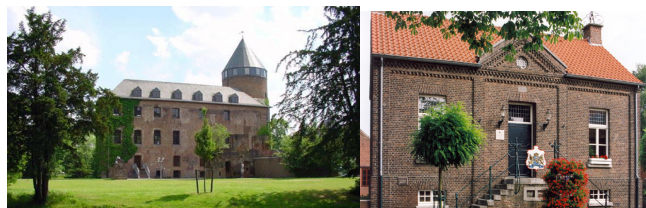
Kulturgeschichte in Brüggem und Beesel

In 2009 beantragten die Gemeinden Beesel und Brüggem ein gemeinsames People 2 People Projekt der euregio rhein-maas-nord. Hier trat der Naturpark Maas-Schwalm-Nette als externer Berater auf, unterstützte die Partner bei Antragsstellung und hilft weiterhin bei der Koordination und inhaltlichen Ausarbeitung.