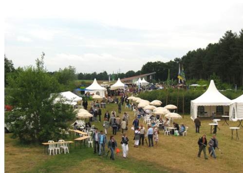
FESTA NATURA 2009

In 2009 wurde das Naturfestival FESTA NATURA ins Leben gerufen. Dabei handelt es sich um ein deutsch-niederländisches Festival, bei dem Naturschutzorganisationen ihre Arbeit vorstellen und Unternehmer Produkte anbieten, die etwas mit der Natur und Landschaft zu tun haben. Der Naturpark Maas-Schwalm-Nette gehörte zum Organisationsteam und stellte seine IT-Struktur für einen Internetauftritt von FESTA NATURA zur Verfügung.