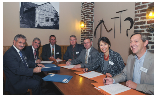
Die Projektpartner unterzeichnen die Kooperationsvereinbarung

Inzwischen wurden gemeinsam mit den Projektpartnern Arbeitsgruppen gebildet, in denen die beiden Themenrouten sowie Naturentwicklungsmaßnahmen ausgearbeitet werden. Dabei arbeiten Heimatvereine, touristische Organisationen und Naturschutzbehörden- und Verbände beiderseits der Grenze zusammen.