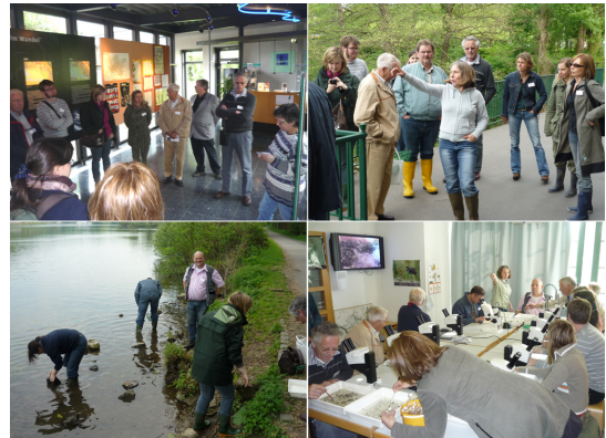
Exkursion Netzwerk 2009

Für das Netzwerk der 21 Besucherzentren wurde am 23. April 2009 eine Exkursion zum Aquarius Wassermuseum und zum Haus Ruhrnatur in Mühlheim an der Ruhr veranstaltet. Die Exkursion lehnte an die Naturparkschau an, die der Naturpark Schwalm-Nette in 2012 unter dem Motto „Wasser“ veranstalten wird. In diesem Zusammenhang wurden Führungen und Workshops rund um das Thema veranstaltet. Im September fand ein Treffen des Netzwerks statt, bei dem die Ergebnisse des Naturparktags 2009 und die weitere Zusammenarbeit besprochen wurden.