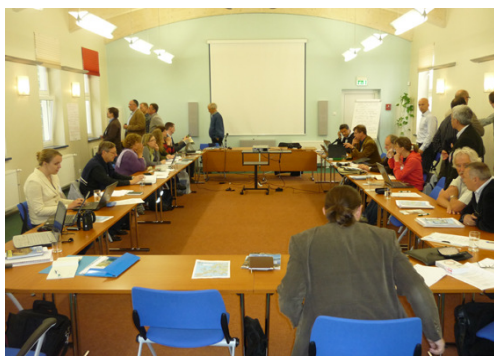
Konferenz in Estland

Als Mitglied der Europarc Federation erhielt der Deutsch-Niederländische Naturpark Maas-Schwalm-Nette im Jahre 2007 das europäische Zertifikat „Transboundary Parks – following nature’s design“. Inzwischen gibt es in Europa zwölf zertifizierte Transboundary Parks. Um das Netzwerk dieser Naturparke und die europäische Zusammenarbeit zu stärken, hatte Europarc Federation zu einem internationalen Treffen der bereits zertifizierten Naturparke und derer, die sich um ein Zertifikat