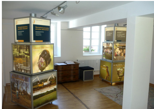
Ausstellung im Klosterhof Dalheim

Die im Rahmen des INTERREG IIIA Projektes „Maas-Schwalm-Nette im Bild“ konzipierte Ausstellung wurde in Text und Bild erneuert. Im Laufe des Jahres wurde sie an verschiedenen Orten sowie bei unterschiedlichen Veranstaltungen präsentiert.