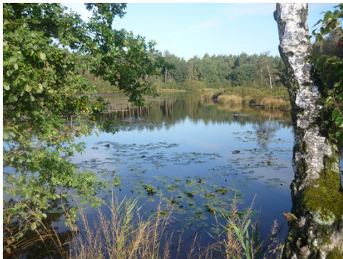
Wandern am Wasser - Melicker Venn

Partner des Projektes sind der Naturpark Schwalm-Nette als Antragsteller, der Naturpark Schwalm-Nette, die niederländischen Gemeinden Leudal, Maasgouw Roerdalen und Roermond sowie die beiden niederländischen Wasserverbände Roer & Overmaas und Peel & Maasvallei. Der Antrag wurde am 1. Dezember durch den Lenkungsausschuss der euregio rhein-maas-nord bewilligt.