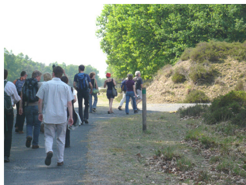
Wanderung im Brachter Wald

veröffentlicht. Der Veranstaltungskalender konnte in 2009 durch entsprechende Finanzmittel aus der Verbandsumlage anteilmäßig finanziert werden.