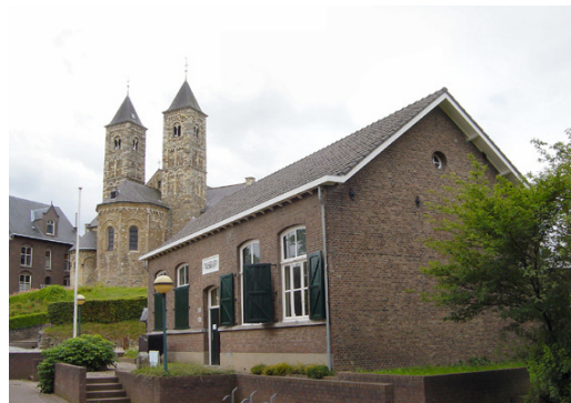
Roerstreekmuseum St. Odiliënberg