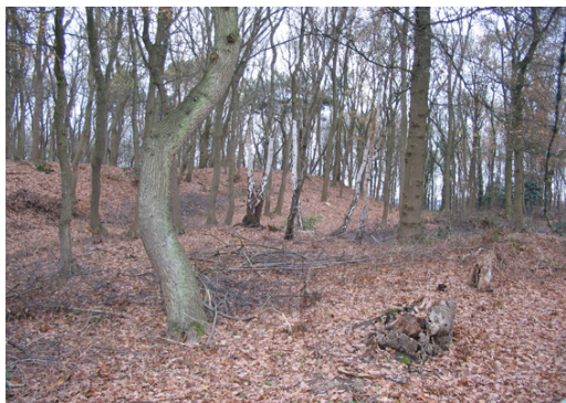
Schans nabij Beesel

De buurgemeenten Beesel en Brüggen kennen allebei een interessante cultuurgeschiedenis, waarvan vele getuigenissen nog in het cultuurlandschap zijn te zien. De beide gemeentes hebben het initiatief genomen hun cultureel erfgoed gemeenschappelijk in een grensoverschrijdende archeologisch-cultuurhistorische route te presenteren.