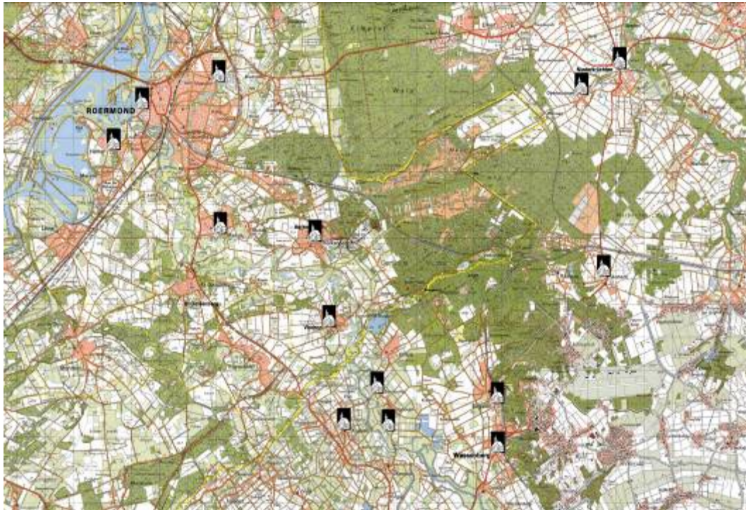
Kerkdorpen van de Meinweg