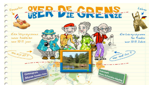
Onderwijsprogramma „Over de Grens“

Het onderwijsprogramma “Over de Grens” voor Nederlandse en Duitse basisscholen werd in 2008 gerealiseerd. Centraal in het programma staan natuur, landschap en de cultuurgeschiedenis van het Grenspark Maas-Swalm-Nette. Het lesmateriaal wordt thans geproduceerd, zodat de komende maanden met de werving op de scholen kan worden begonnen. Het onderwijsprogramma geeft de scholieren de mogelijkheid de geschiedenis en betekenis van het Grenspark te leren. Daarbij komen in het bijzonder de vakken geschiedenis, geografie en biologie aan bod.