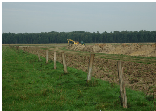
Afvoer bovengrond Wolfsplateau

Na het succesvol uitvoeren van de maatregelen voor herstel van veenmoerassen in de natuurgebieden Blankwater en het Herkenboscher Venn werden in 2008 nog de resterende gronden door Staatsbosbeheer afgevoerd.