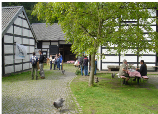
NABU Naturschutzstation Wildenrath

Ook de activiteiten van het netwerk van de 21 bezoekerscentra werd na de formele afloop van het project voortgezet. In samenwerking met het Duitse Naturpark Schwalm-Nette werden in 2008 twee bijeenkomsten georganiseerd. In mei vond de bijeenkomst plaats op het bezoekerscentrum van de NABU Naturschutzstation Wildenrath. Bij die gelegenheid werd het kort tevoren geopende nieuwe natuurbelevisterrein bezocht. De bijeenkomst in september vond plaats in het Roerstreekmuseum in St. Odiliënberg, daarbij werd een rondleiding door het museum gehouden. De lokale geologie en de archeologie stonden daarbij in het middelpunt.