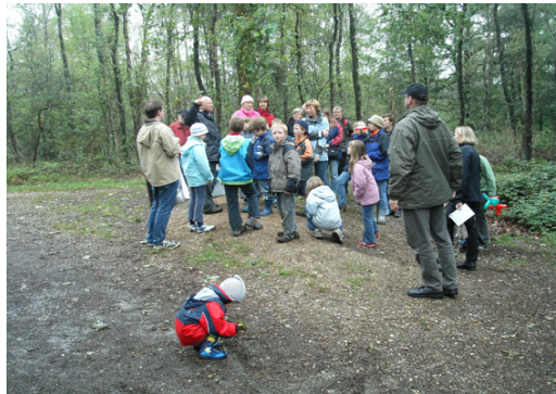
Geführte Wanderung im Naturpark

In 2008 werden aan weerszijden van de grens in totaal 605 evenementen op internet aangeboden en via de drie excursiegidsen met een totale oplage van 30.000 exemplaren tweetalig gepubliceerd. 40 % van de evenementen werden aan Nederlandse zijde aangeboden en 60 % aan Duitse zijde. In vergelijking met het voorafgaande jaar (32 % NL en 68 % D) is het aanbod evenwichtiger geworden. Het gemiddelde aantal deelnemers aan de evenementen bedroeg in 2008 18 personen. Indien de grote evenementen, zoals de natuurparkdag en de wandel- en fietsdagen, worden meegerekend namen in 2008 ca. 30.000 personen deel aan de evenementen. In december werd de nieuwe excursiegids voor het voorjaar 2009 met 183 evenementen gepubliceerd. Het evenementenprogramma is steeds actueel te vinden op de internetsite van het Grenspark www.grenspark-msn.nl . De publicatie van de excursiegids na afloop van het project werd in 2008 en 2009 mogelijk door de door het algemeen bestuur besloten verhoging van de deelnemersbijdrage.