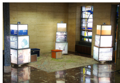
Expositie in het raadhuis in MG-Rheydt